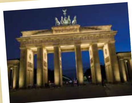
Puerta de Brandemburgo

Finalmente, su guía les acompañará hasta el alojamiento para cenar.