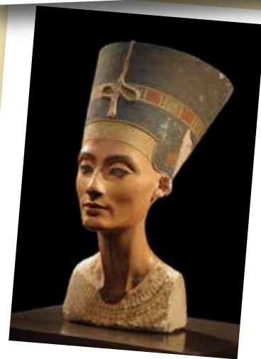
Busto de Nefertiti