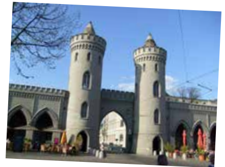
Puerta de Nauen