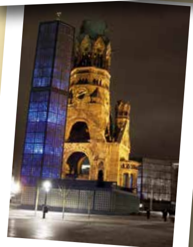
Iglesia del Káiser Guillermo