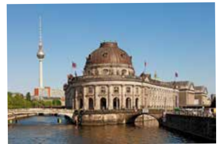
Isla de los museos