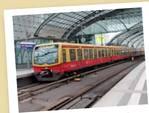
Billetes transporte público y traslados aeropuerto