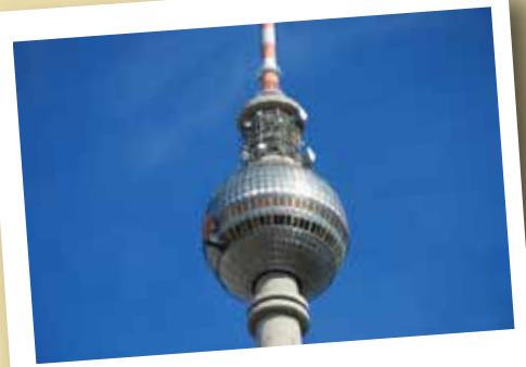
Torre de la televisión

Seguidamente su guía les acompañará hasta el alojamiento para cenar.