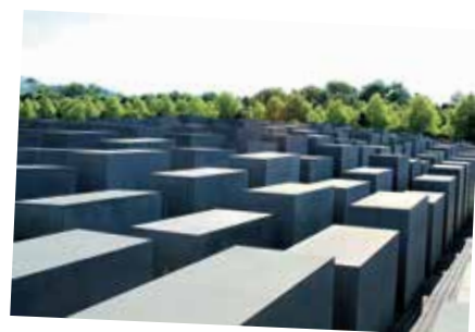
Monumento del Holocausto