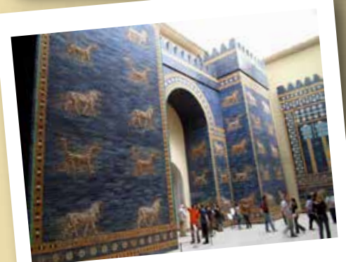
Museo de Pérgamo