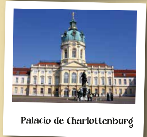
Palacio de Charlottenburg