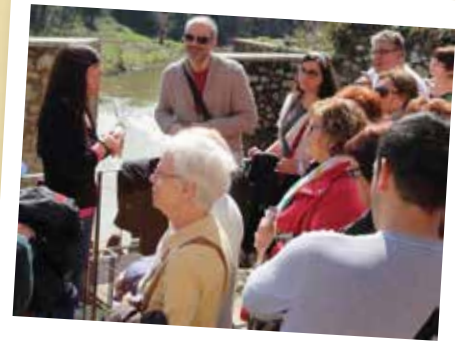
Visitas guiadas y entradas